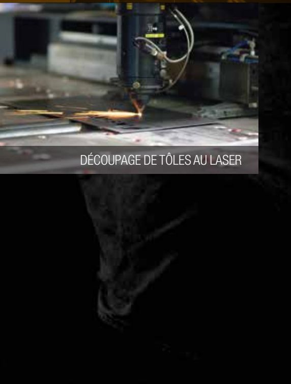
DÉCOUPAGE DE TÔLES AU LASER