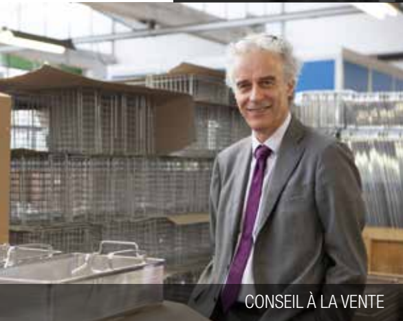
CONSEIL À LA VENTE