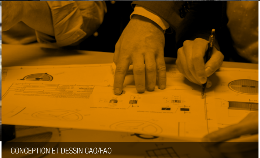
CONCEPTION ET DESSIN CAO/FAO