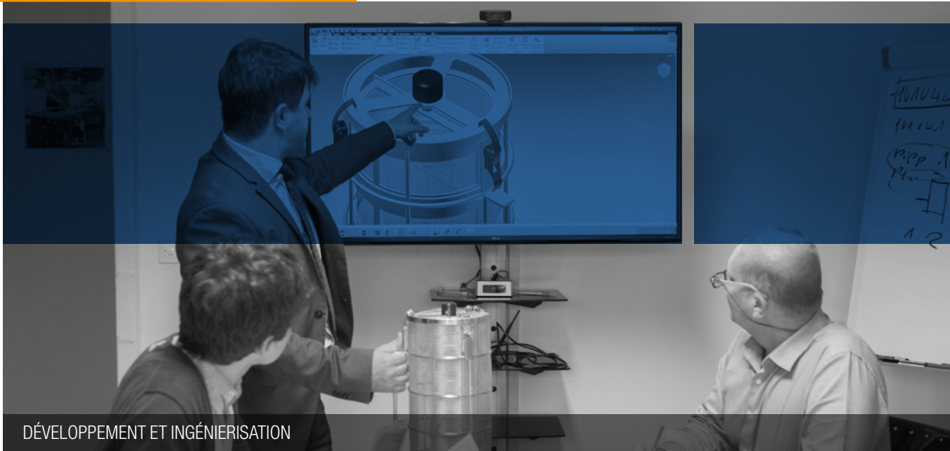
DÉVELOPPEMENT ET INGÉNIERISATION