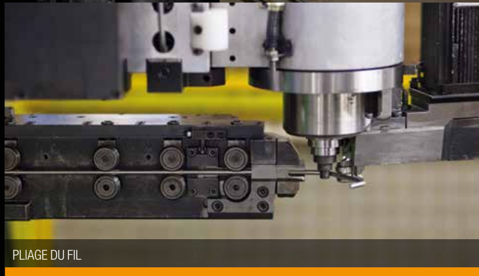
PLIAGE DU FIL